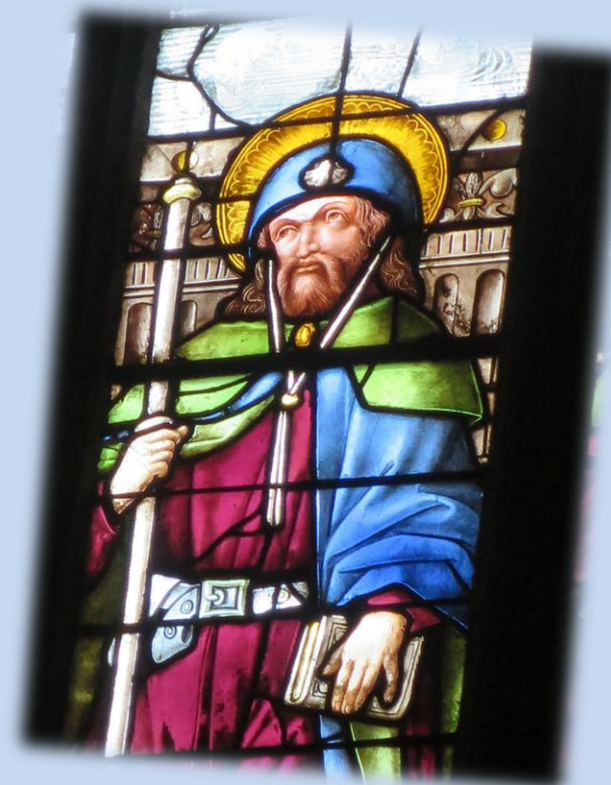
Le Saint Jacques des vitraux d'Arnaud de Moles