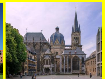
La cathédrale d'Aix la Chapelle