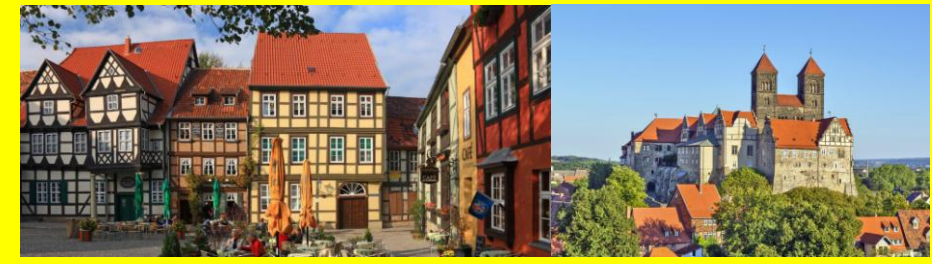
La cité médiévale de Quedlinburg