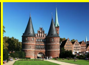
Ville Hanséatique de Lübeck