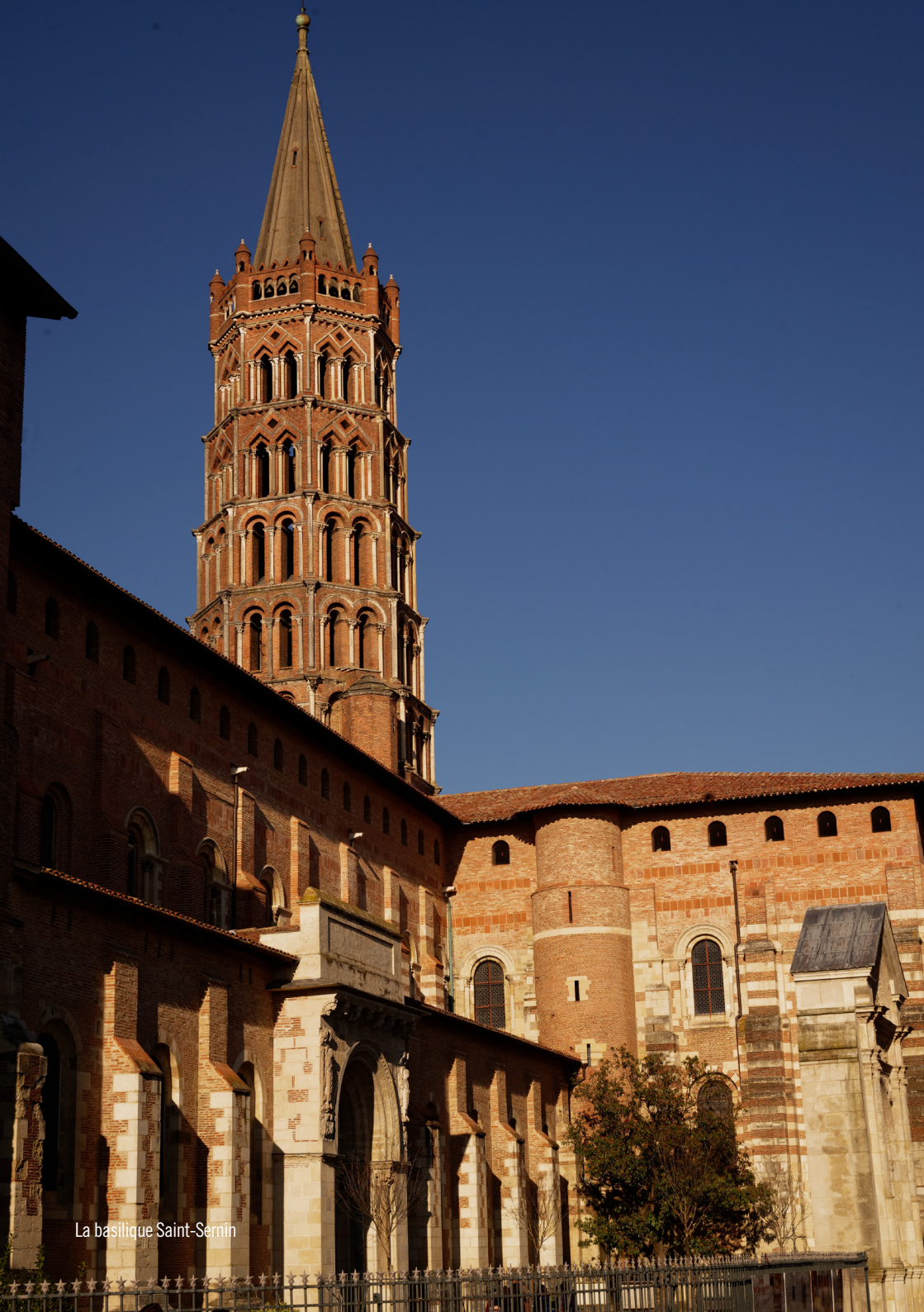
La basilique Saint-Sernin