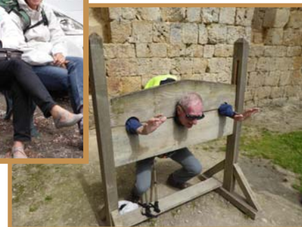
... d'autres subissent le supplice