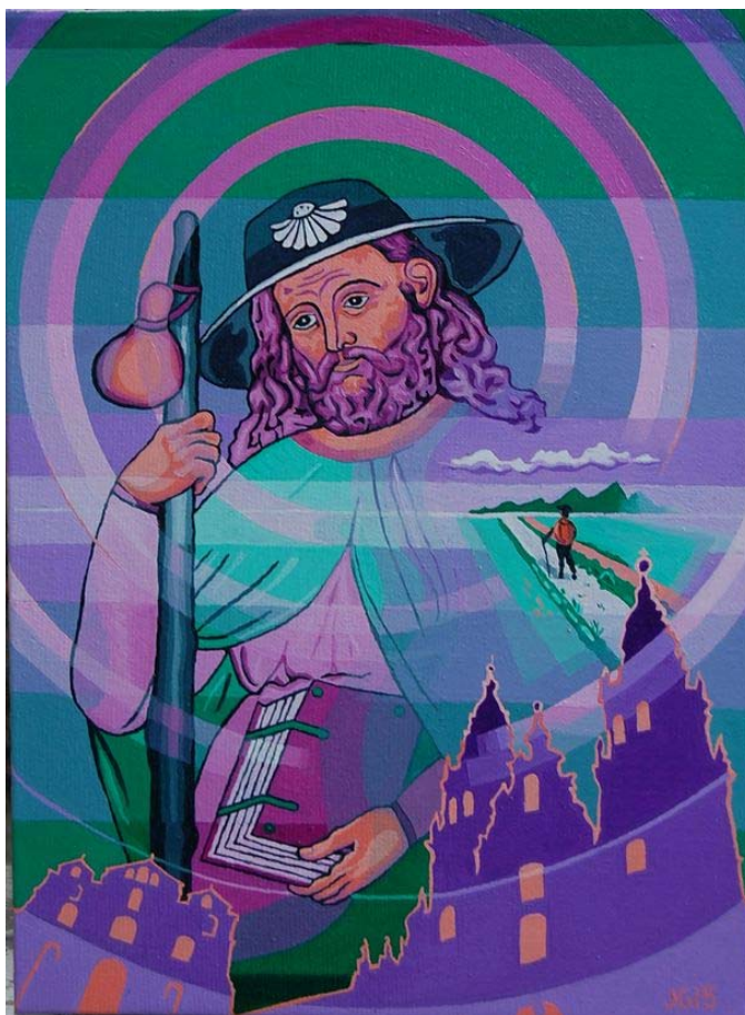
Saint Jacques. Peinture d'un adhérent souhaitant rester anonyme.