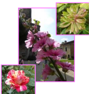
C'était le temps des fleurs