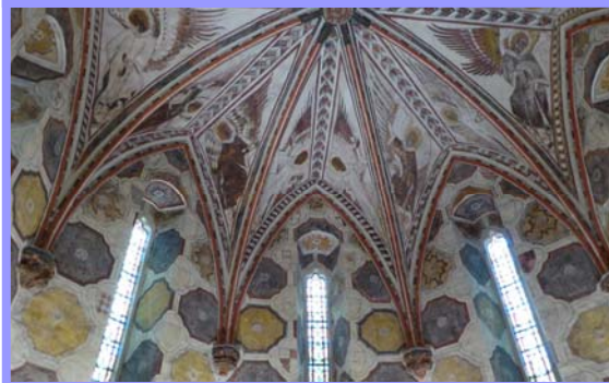
Le plafond de la sacristie de la Collégiale