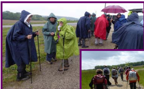
Après la pluie vient le beau temps