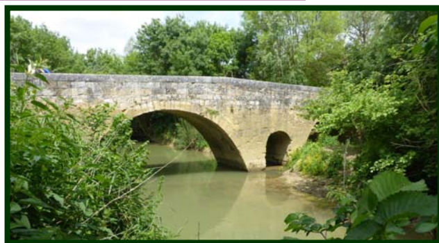
Le pont de l'Artigue