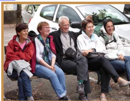
En bonne compagnie alors que...