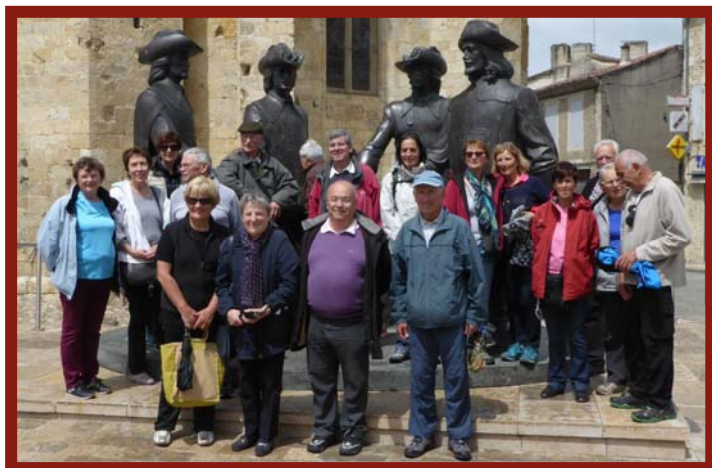
Les mousquetaires nous attendaient pour la photo de famille